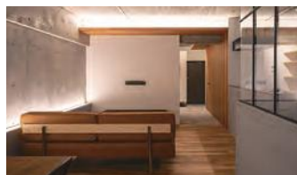
谷尻 誠 賞 躯体ヲ魅セルマンションリノベ