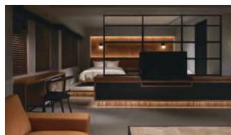
グランプリ 太平洋クラブ 軽井沢ヴィラ・ザ・クラブ

壁・天井材ブランド「the wall」シリーズの施工事例コンテストを2019年7月1日～2020年1月31日の期間で実施。プロユーザー様から多数の施工例写真が寄せられました。審査員に建築家の谷尻誠氏とアートディレクターの川上シュン氏を迎えて、朝日ウッドテックの社員とともに審査会を行い、グランプリ1名、谷尻誠賞1名、川上シュン賞1名、woodtec賞10名、ディテール賞3名、入選50名が決定しました。